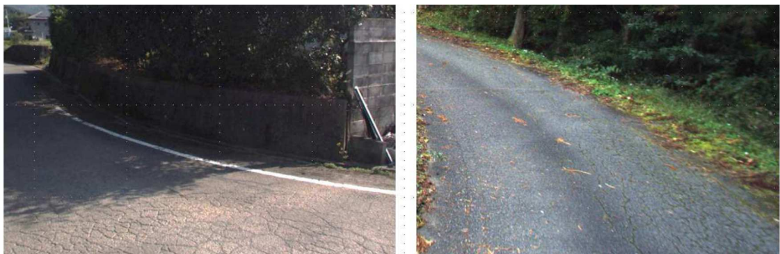
図 1-1 舗装のひび割れ (左)・わだち掘れ (右)

平成 25 年度および令和 3 年度に移動計測車両による測量システム MMS(Mobile Mapping System)を用いて道路舗装調査を実施しています。計測車両により、ひび割れ・わだち掘れ・平坦性を計測することができます。