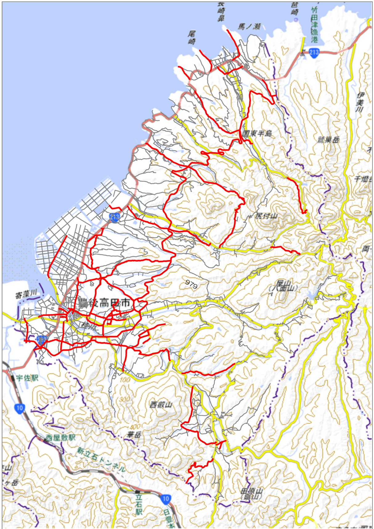
図 2-1 路面性状調査対象路線