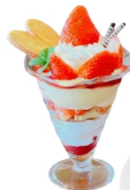
苺のミルフィーユパフェ