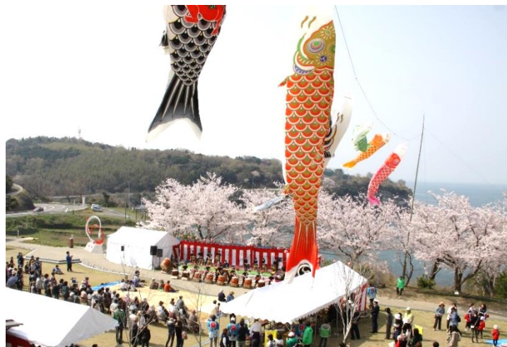
粟嶋公園花まつりの様子（第11回）