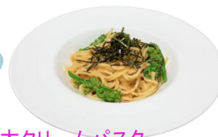
菜の花明太クリームパスタ