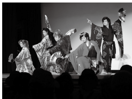
満員の観衆を魅了した大衆演劇

令和4年度まで1人あたり1,000円としていた敬老会実施補助金は、県内他市の倍額以上の2,000円に増額し、高齢者の皆さんがより楽しめる敬老会への支援を拡充しました。