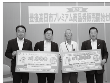
第7弾プレミアム商品券 販売開始セレモニー

また、第6弾・第7弾の30%お得なプレミアム商品券を発行し、物価高騰の中で生活する市民を支援しました。