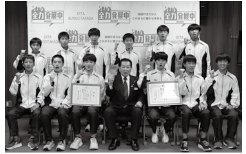
高田中学校男子陸上部