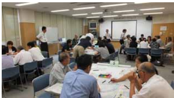
▲ ワークショップ(第1回)