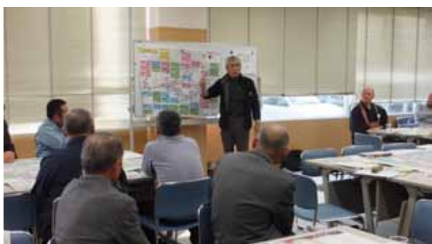
▲ ワークショップ(第3回)