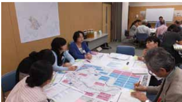
▲ ワークショップ(第2回)