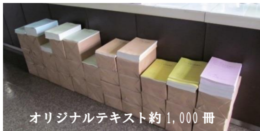
オリジナルテキスト約1,000冊