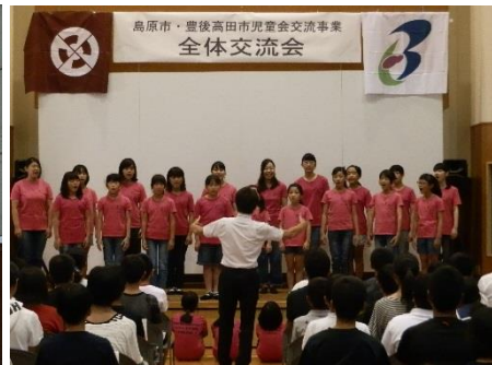
市の行事での出演