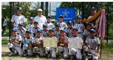
高田スポ少 平成29年度全九州学童軟式野球大会優勝