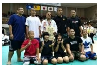
戴星学園柔道部 平成29年度大分県総合体育大会優勝、九州大会、全国大会出場