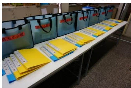
各教室の3点セット