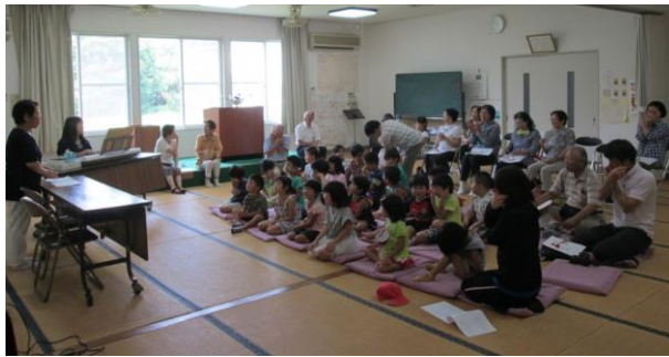
昔のお話と歌の会