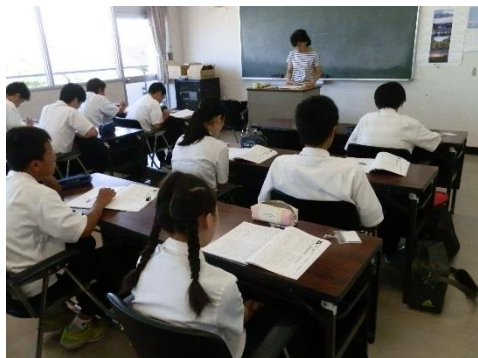
夏季特別講座（中央公民館）

夏休み・冬休み期間中に学力の向上を図るため、中学3年生を対象に英語・数学・国語の復習を行う7日間の講座です。 会場：中央公民館、豊後高田市教育会館、真玉公民館 講師：退職校長、塾経営者、市民講師、大学生等