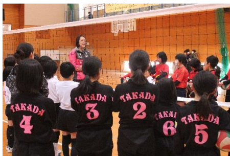
元全日本選手によるバレー教室