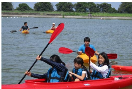
カヌー教室(世界大会出場者も輩出)