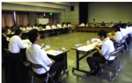
「昭和のまちは教育のまちです」実行委員会