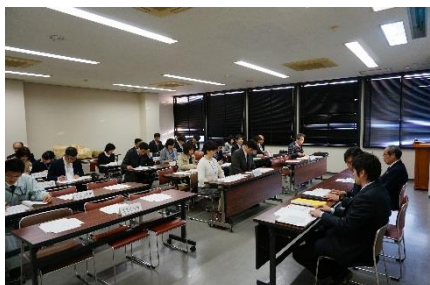
講師打合せ(研修会)