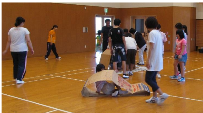
ダンボール・キャタピラー