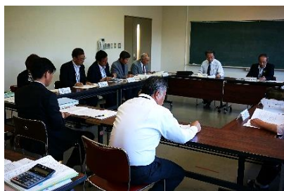
「学びの21世紀塾」実行委員会