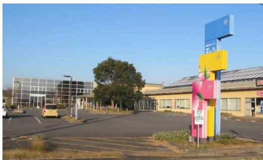
健康交流センター「花いろ」

健康交流センター(通称花いろ)では、5才児を対象にして、高田小、真玉小、香々地小学校では小学生を対象にして開催しています。