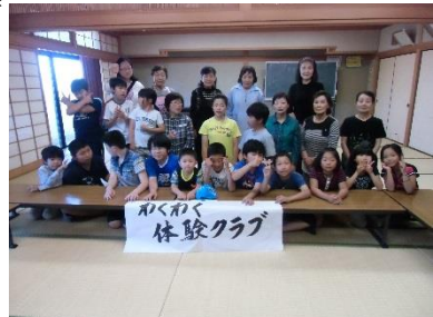
わくわく体験クラブ