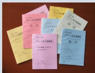
オリジナルテキスト