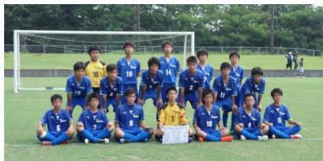
高田中 平成29年度大分県総合体育大会準優勝