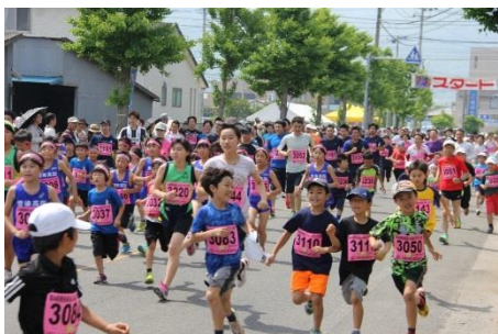
仏の里豊後高田ふれあいマラソン大会