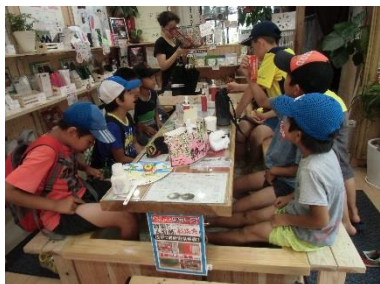
地域探検 (昭和のまちの「足湯」)