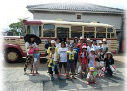
ボンネットバスで史跡探訪