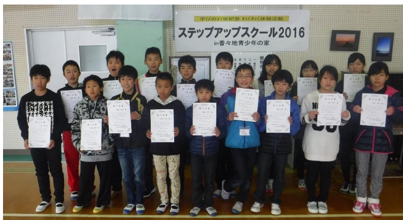
受講認定書を掲げて修了式

平成23年度からは、各中学校6名の校長による「熱血まるごと体験授業」を行なっています。