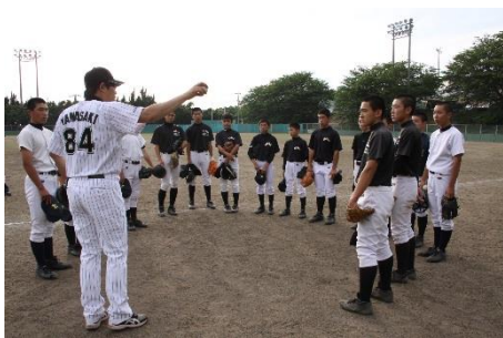
元プロ野球選手による野球教室