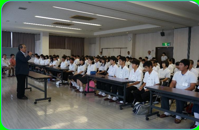
夏季特別講座開講式（教育会館）