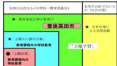
土曜日の有効活用の分類

今では、全国的に土曜日学習が広がり、各教育委員会の方針に添って土曜日の有効活用が図られています。