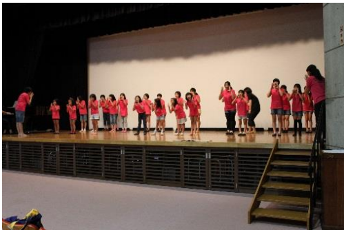
公民館大ホールでの練習