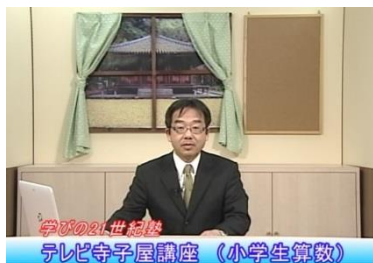
学びの21世紀塾 テレビ寺子屋講座（小学生算数）