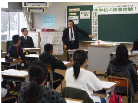
中学校校長による英語教室