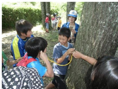
自然観察ネイチャー教室