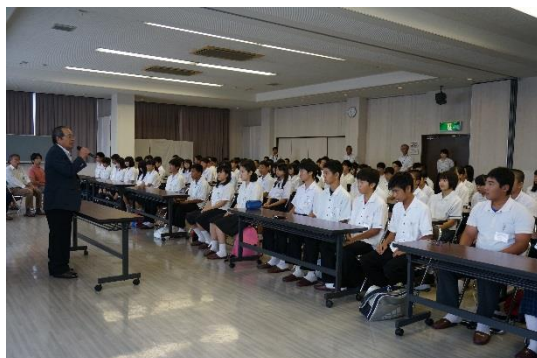
夏季特別講座開講式