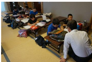
寺子屋「プラチナ館」