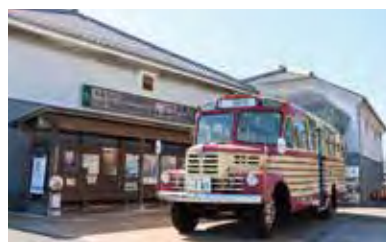
豊後高田昭和の町(ボンネットバス)