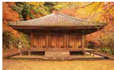
国宝・富貴寺大堂