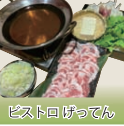
ピストロ げってん