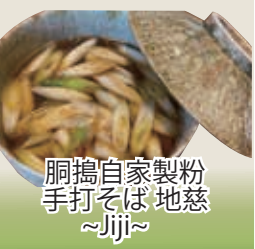
胴搗自家製粉 手打そば 地慈 ~Jiji~