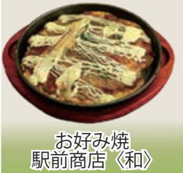
お好み焼 駅前商店〈和〉