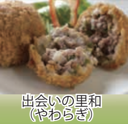
出会いの里和 (やわらぎ)