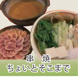
串焼 ちよいとそこまで