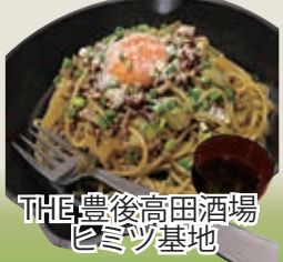
THE豊後高田酒場 ヒミツ基地