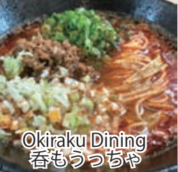
Okiraku Dining 呑もうっちゃ