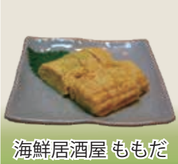
海鮮居酒屋 ももだ