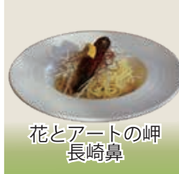
花とアートの岬 長崎鼻