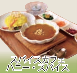
スパイスカフェ ハニー・スパイス