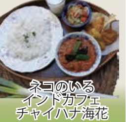
ネコのいる インドカフェ チャイハナ海花