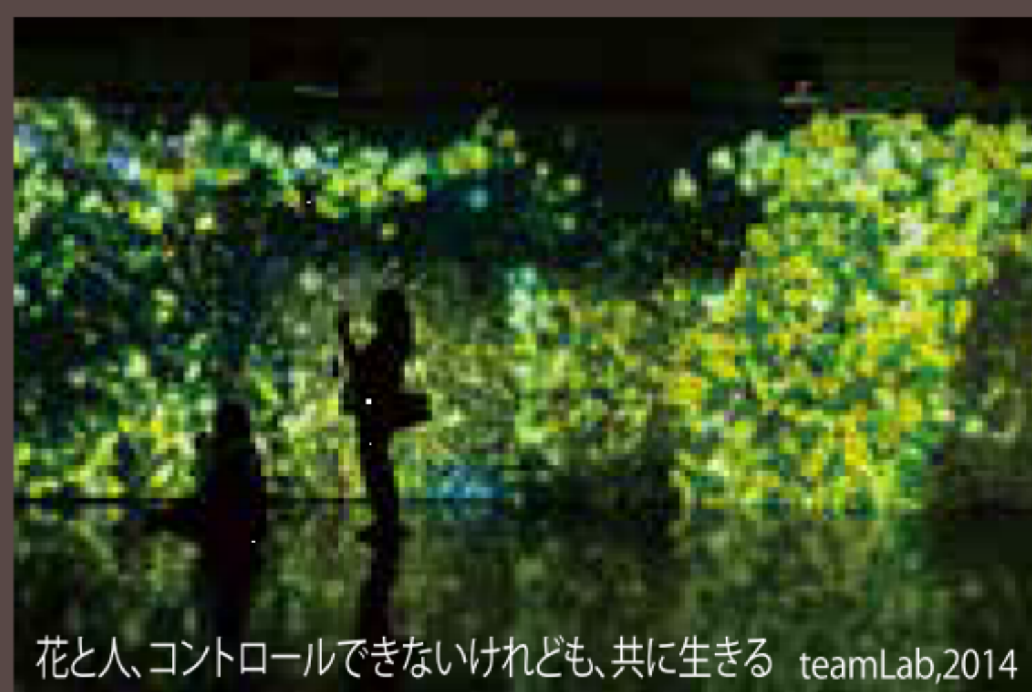
花と人、コントロールできないけれども、共に生きる teamLab,2014

この草原は、みんなの描いたピープルが集まる広場です。紙に自由にピープル(男性や女性など)の絵を描きます。すると、描いた絵に命が吹き込まれ、「夕焼けの真玉海岸」をバックに、目の前の巨大な草原で歩き出します。