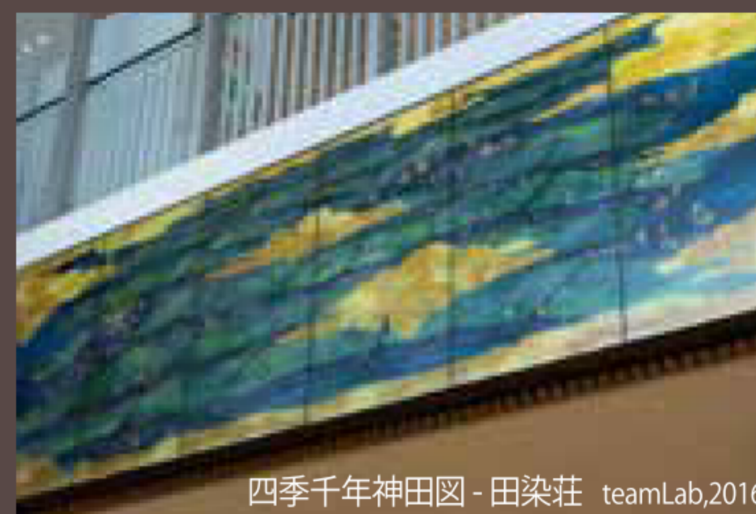
四季千年神田図 - 田染荘 teamLab,2016

国東半島に生息している花々をモチーフにしており、一時間を通して、国東半島の一年間の花々が移り変わっていく。花は生まれ、成長し、つぼみをつけ、花を咲かせ、やがて散り、枯れて、死んでいく。