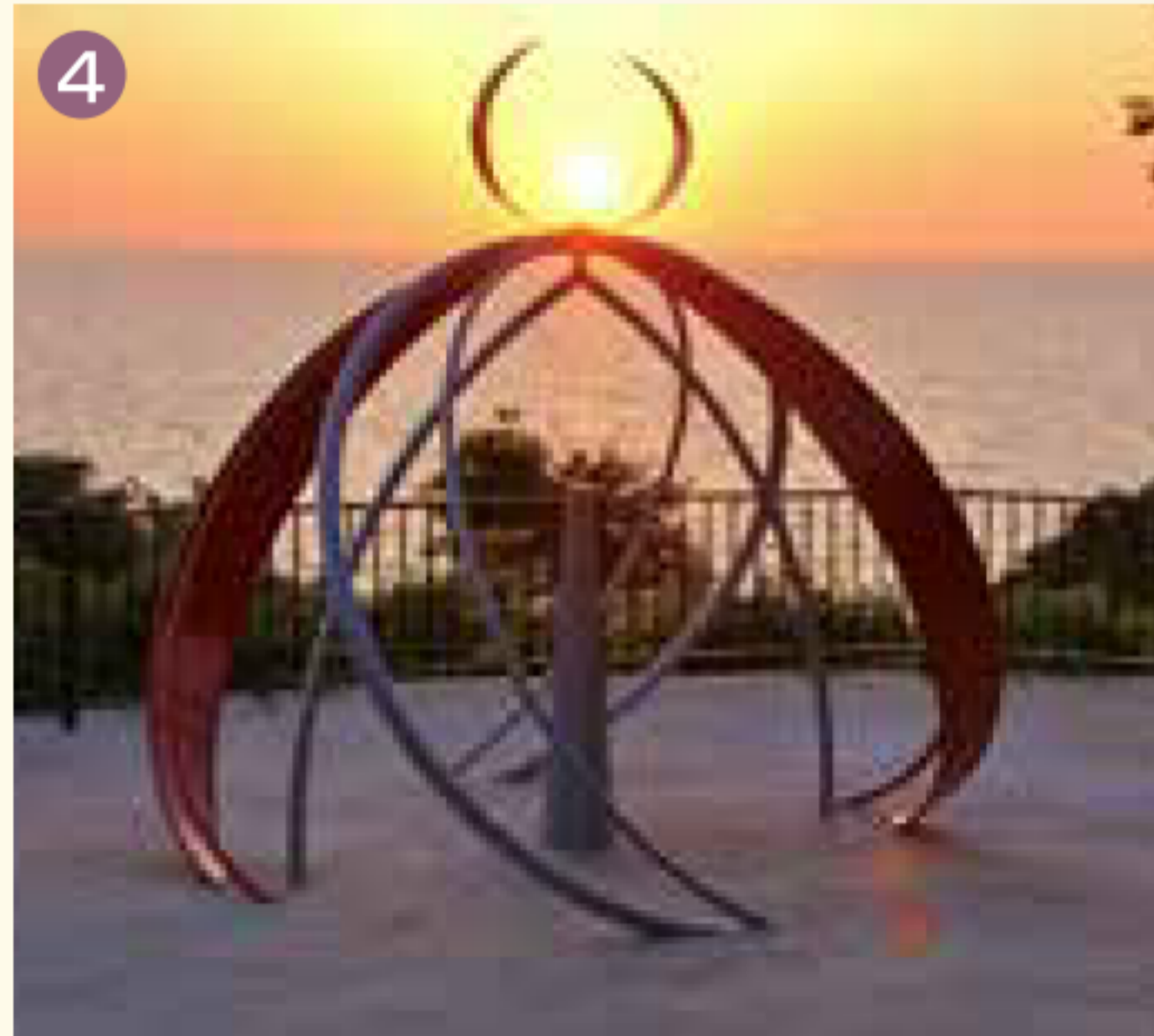
南京錠を掛けて愛を誓う愛鍵モニュメント「緑」