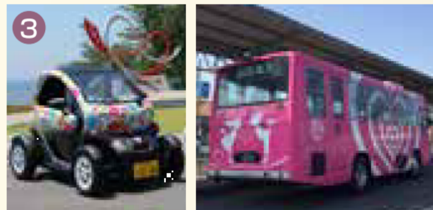
ドライブに最適な超小型モビリティ「ハートの魔法」が描かれた路線バス

市内の中心商店街は、江戸時代から明治、大正、昭和30年代にかけて、国東半島で一番栄えた町でしたが、だんだんと時代の波に取り残され、寂しい町になっていました。そこで、商店街が元気だった戦後の時代、あの昭和30年代の元気、活気を蘇らせようと平成13年に立ち上げたのが「昭和の町」です。懐かしい商店街は、全国的にも脚光を浴びて、年間35万人もの来訪者を迎える観光地になっています。