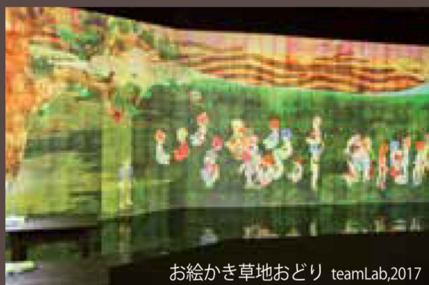
お絵かき草地おどり teamLab,2017

デジタル社会の様々な分野のスペシャリストから構成されているウルトラテクノロジスト集団。アート、サイエンス、テクノロジー、クリエイティビティの境界を越えて、集団的創造をコンセプトに活動している。 http://teamlab.art/jp/